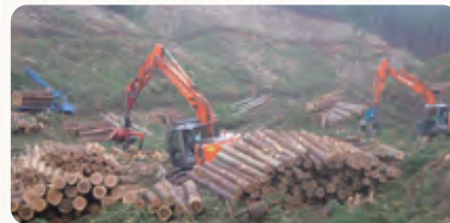
大型重機による皆伐作業

平均年齢は、41歳！ 20、30代が多く、活気 のある職場です。ほとん どの職員が未経験から始 めています。一緒に頑張 りましょう！